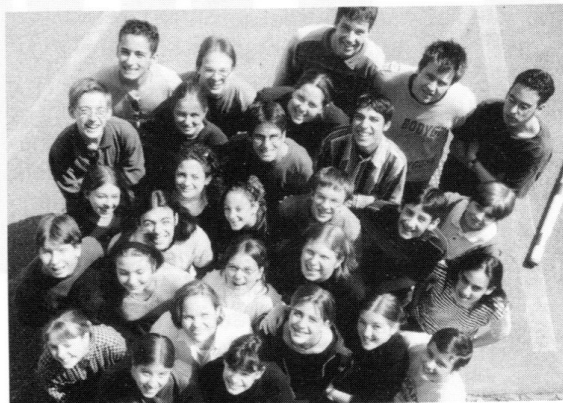
Gymnasium Untere Waid